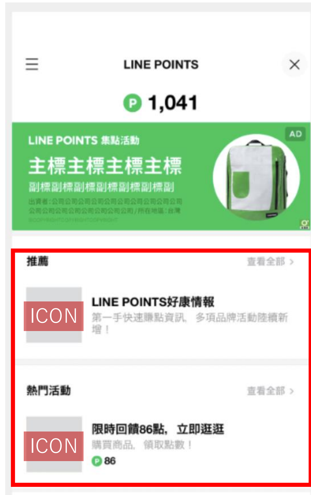
LINE POINTS ADS任務牆