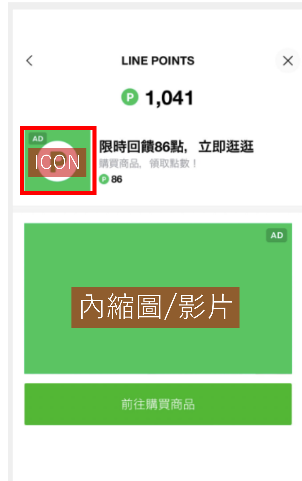
LINE POINTS ADS ICON/內縮圖