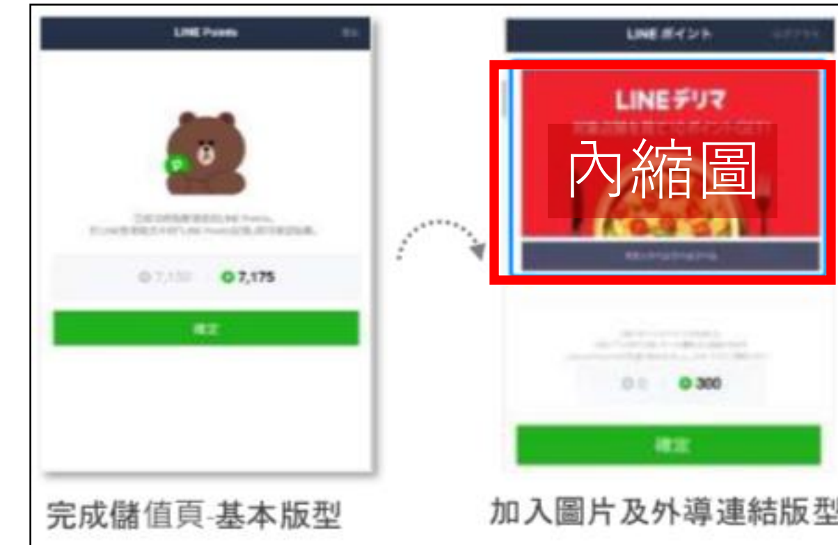
LINE POINT CODE 內縮圖